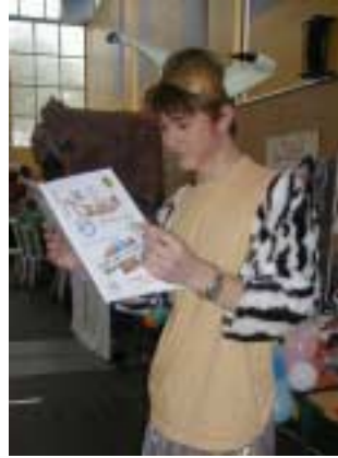
Propos recueillis et mis en forme par JPB et DCJ

Kevin : A mon avis, ce serait plutôt "le Zap"