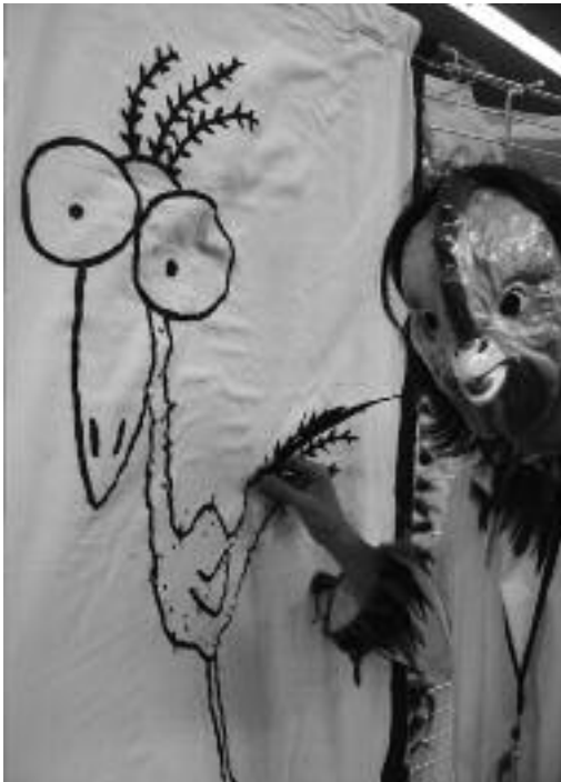
Le Héron n'est pas mort, mais il a déjà donné toutes ses plumes